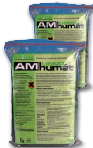
Lignohumát AM je dodáván v balení 1 kg a 20 kg

Vzhledem k svému pozitivnímu vlivu na rostliny během celého vegetačního období je vhodné zařazovat Lignohumát AM pravidelně do pěstebních postupů, čímž se zlepšuje zdravotní stav porostu. Pozitivní efekt preventivních aplikací se projevuje zejména v období kdy rostliny musí překonávat různé stresy.